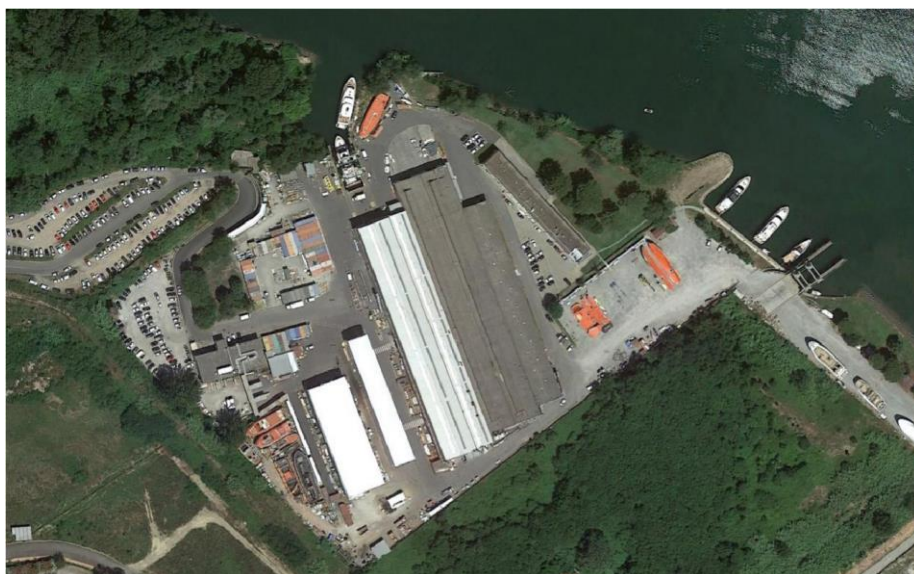
Figura 1 - foto aerea dello stabilimento produttivo di Sanlorenzo Spa