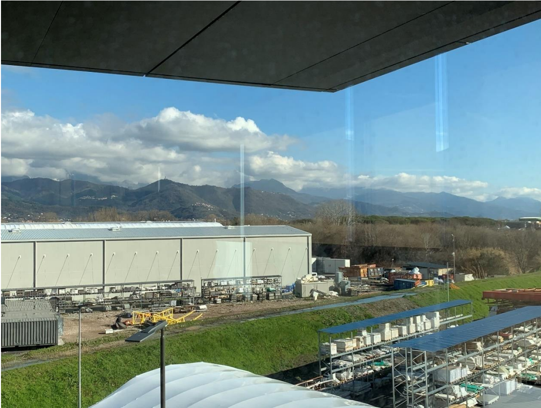
Figura 3 – stato di fatto dell'area di intervento