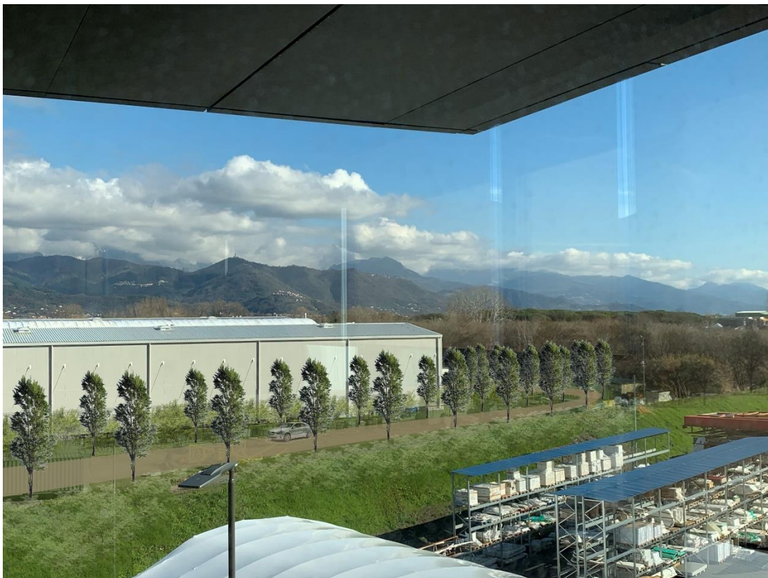
Figura 4 – foto inserimento della modifica all'assetto vegetazionale